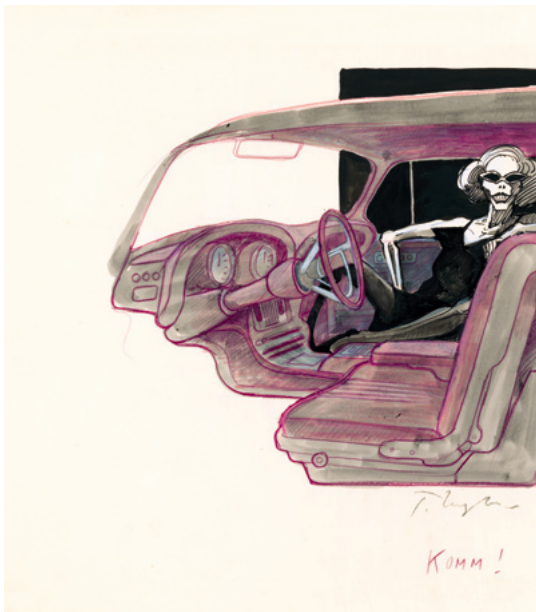
Komm! / Come! Undatiert / undated Tusche und Farbstifte auf Pergament / Ink and crayon on parchment paper 48 x 61 cm Inv. 6115

In his many works, Ungerer effortlessly alternated the Romantic style of the German almanach with the rapid stroke of a Wilhelm Busch, the illustration art of his fellow Alsatian Gustave Doré, the bite of French social satirists like Grandville, and the