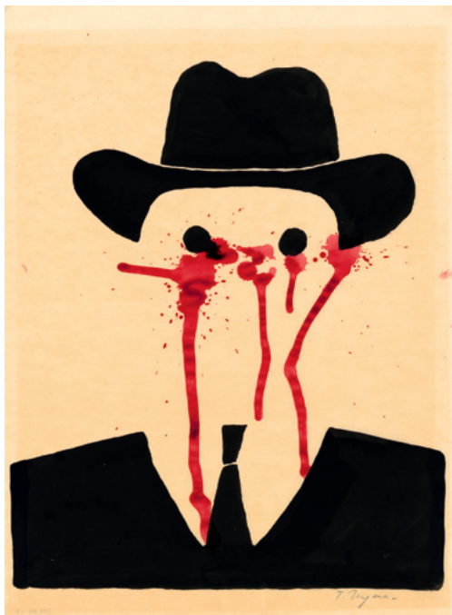
Ohne Titel (Entwurf für das Theater Dortmund) / Untitled (Sketch for the Theater Dortmund), 1986/87 Tusche und farbige Tinte, laviert, auf Transparenz- papier / Ink, washed, on transparent paper 47,5 x 34 cm Inv. 14346

begann sein eigentlicher Aufstieg im New York der 1950er-Jahre, wo er als Grafiker, Kinderbuchautor, Zeichner und Maler berühmt wurde. Zeitlebens war er politisch engagiert. Seine Plakate gegen den Vietnamkrieg und die Rassentrennung sind beredte Stellungnahmen und gehören zugleich zu den besten Beispielen der modernen Grafik. Unterhaltsam und ebenso drastisch sind seine bitterbösen