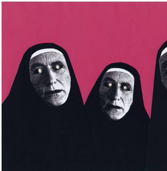
Ohne Titel (Das Martyrium der dreifachen Identität) / Untitled (The Martyrium of the Threefold Identity), 2009 Collage und Farbstift auf Papier / Collage and crayon on paper 50 x 70 cm Inv. 14288

1950s, where he became famous as a graphic artist, children's book author, draftsman and painter. Throughout his lifetime he was politically committed. His posters protesting the Vietnam War and racial segregation are eloquent examples of this and count among the finest products of contemporary graphic art. His acerbic commentaries on American high society were both entertaining and