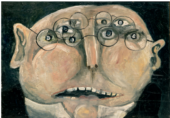
L'Homme aux Lunettes / Der Mann mit Brille / The Man with Glasses, 1963 Öl auf Leinwand / Oil on canvas 64 x 91 cm Inv. 6098

begann sein eigentlicher Aufstieg im New York der 1950er-Jahre, wo er als Grafiker, Kinderbuchautor, Zeichner und Maler berühmt wurde. Zeitlebens war er politisch engagiert. Seine Plakate gegen den Vietnamkrieg und die Rassentrennung sind beredte Stellungnahmen und gehören zugleich zu den besten Beispielen der modernen Grafik. Unterhaltsam und ebenso drastisch sind seine bitterbösen