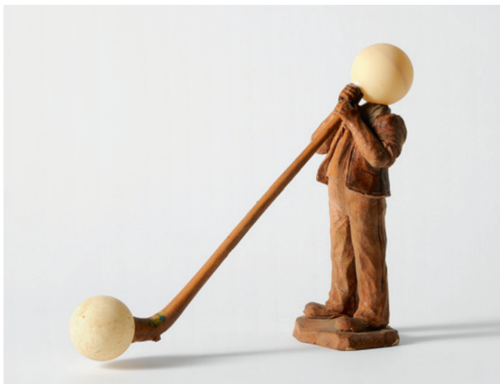
Alpenhorn, 2006 Objekt aus Fundstücken / Sculpture of found objects 18 x 21 x 7 cm Inv. 14332

Die Ausstellung im Forum Würth Rorschach, die auf den reichen Bestand von 240 Werken Tomi Ungerers in der eigenen Sammlung zurückgreifen kann, bietet einen inhaltlichen Querschnitt durch das ebenso tiefgängige wie überaus kurzweilige Œuvre dieses leidenschaftlichen Künstlers.