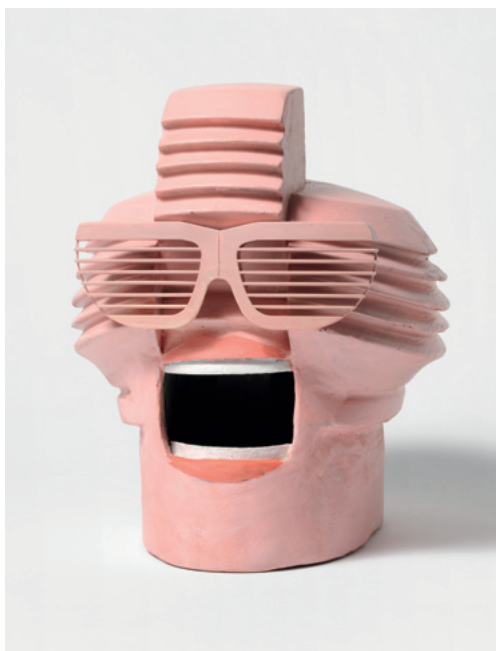
Florida Welcome, 2010 Objekt aus Fundstücken / Sculpture of found objects 23,5 x 19 x 21 cm Inv. 14297

1950s, where he became famous as a graphic artist, children's book author, draftsman and painter. Throughout his lifetime he was politically committed. His posters protesting the Vietnam War and racial segregation are eloquent examples of this and count among the finest products of contemporary graphic art. His acerbic commentaries on American high society were both entertaining and