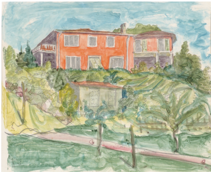
Hermann Hesse Casa Bodmer 1931 Aquarell/ Watercolor 20,2 x 25,2 cm Sammlung Würth, Inv. 8176

For Hermann Hesse, painting was “a way of resting, a liberation from the accursed world of the will and a means of gaining distance from literature”. He enjoyed painting in his youth, but it was not until he suffered an acute nervous breakdown during the First World War that he took it up seriously as a form of self-help. As a self-taught artist, he initially illustrated his own manuscripts and poems, before going on to produce mainly colourful pictures of the landscape in Ticino, where he had settled. “I do not consider myself a painter,” he wrote in 1952, “but painting is wonderful. Afterwards, one’s fingers are not black, as with writing, but red and blue.” The full importance of this “dabbling” did not emerge until his estate was examined and it transpired that the writer had devoted about a third of his energies to painting. In his many sensuously coloured compositions Hesse aimed for poetic, not naturalistic truth.