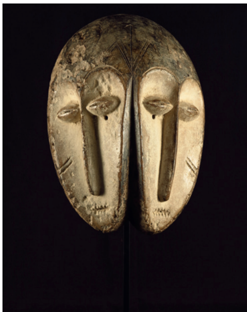
Teil einer Lukwakongo – Maske / Bwami-Kult / Kongo Part of a Lukwakongo Mask / Bwami Cult / Congo Holz, Kaolin, Bast, Kordel, Faser Wood, kaolin, bast, cord, fiber Sammlung José de Guimarães, Inv. 4894

This concentration of works is the unusual prerequisite for the large-scale exhibition at the Forum Würth Rorschach, which pays homage to the oeuvre of one of the most exciting artists in Portugal and reveals ever new aspects.