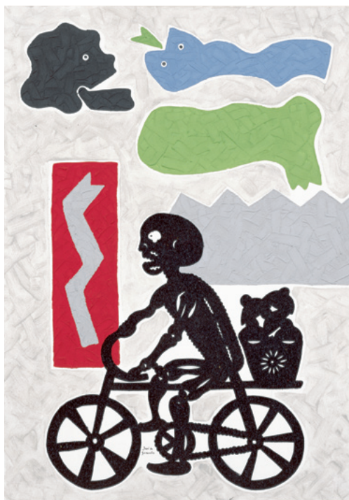
Série México: A morte – Papeles Picados Mexiko-Serie: Der Tod – Gestanzte Papiere Mexico Series: The Death – Punched Paper, 1996 Papier, kaschirt auf Leinwand, Acryl mit Sand und Glitter Laminated paper on canvas, acrylic with sand and glitter 100 x 70 cm Sammlung Würth, Inv. 3630

The artist's initiation took place during a stay in Angola, when he developed his own artistic idiom under the first influence of Pop Art and then in direct contact with African ethnography. Later he discovered countries like Mexico and Japan and repeatedly went in search of a form of expression in which traditional cultures and modernity engage in dialogue with one another.