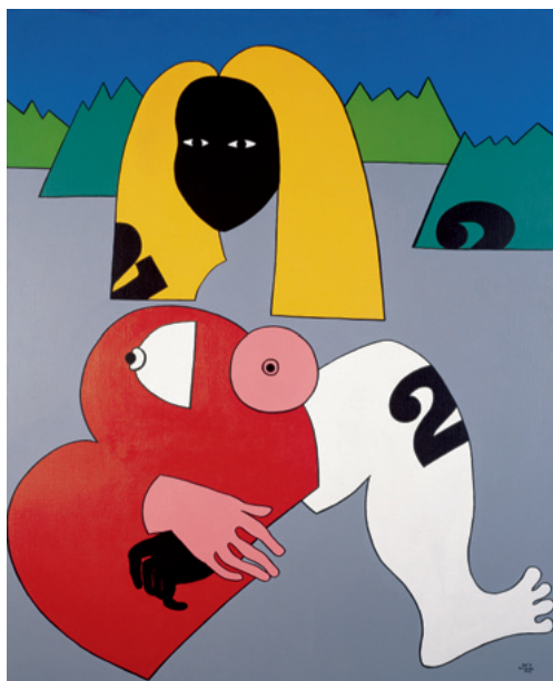
Gioconda negra Schwarze Mona Lisa Black Gioconda, 1975 Acryl auf Leinwand Acrylic on canvas 99,5 x 80 cm Sammlung Würth, Inv. 6464

Beruhend auf dem Zuschneiden, der Zergliederung und Auflösung von Zeichen entstehen diverse Kombinationen in den verschiedensten Werkstoffen – von einem Symbol-Alphabet bis zu monumentalen Werken im Rahmen urbaner Kunst.