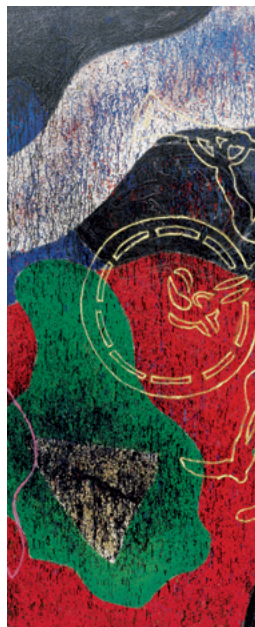
Série Hong Kong: Sonho no pagode do Palácio celeste Hong Kong-Serie: Traum in der Pagode des himmlischen Palastes Hong Kong Series: Dream in the Pagoda of the Heavenly Palace, 1997 Acryl auf Leinwand Acrylic on canvas 250 x 600 cm Sammlung Würth, Inv. 4040

Diese Verdichtung ist die aussergewöhnliche Voraussetzung für die gross angelegte Ausstellung im Forum Würth Rorschach, die dieses immer noch neu zu entdeckende Werk eines der spannendsten Künstler Portugals würdigt.