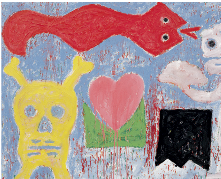
Série México: Serpente vermelha e caveira Mexiko-Serie: Rote Schlange und Totenkopf Mexico Series: Red Snake and Skull, 1997 Acryl und Mischtechnik auf Leinwand Acrylic and mixed media on canvas 130 x 195 cm Sammlung Würth, Inv. 5325

This concentration of works is the unusual prerequisite for the large-scale exhibition at the Forum Würth Rorschach, which pays homage to the oeuvre of one of the most exciting artists in Portugal and reveals ever new aspects.